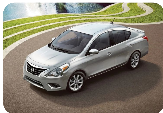
NISSAN VERSA – ADVANCE 2016 CP CDMX

* El nombre de la cobertura puede ser diferente acorde a la aseguradora seleccionada.